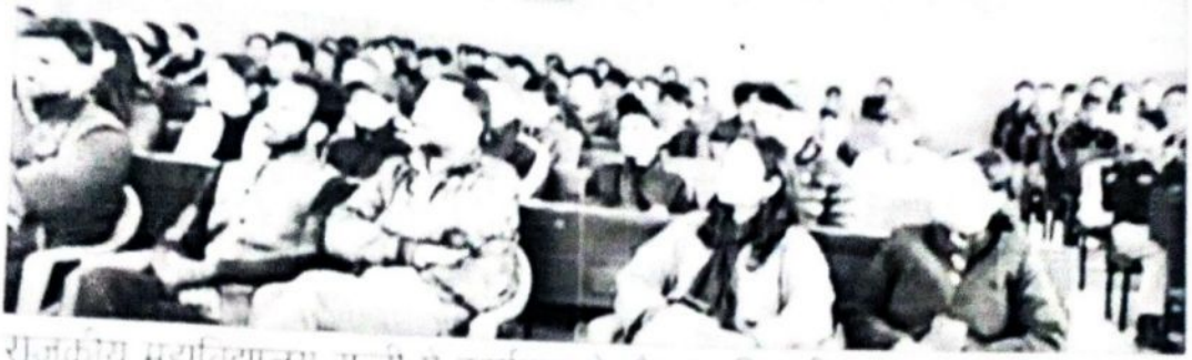
राजकीय महाविद्यालय सुन्नी में कार्यक्रम में मौजूद प्रतिभागी।